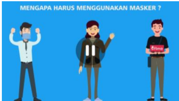
Gambar 1. Contoh Media Edukasi

Pada tahap ini, relawan merencanakan waktu pelaksanaan promosi kesehatan, menentukan media dengan bahasa yang disesuaikan dengan daerah setempat. Pemberian edukasi dilakukan setelah dilakukan wawancara tahap pertama dengan menggunakan media berupa poster atau video animasi dengan bahasa yang sudah disesuaikan dengan daerah setempat (gambar 1)