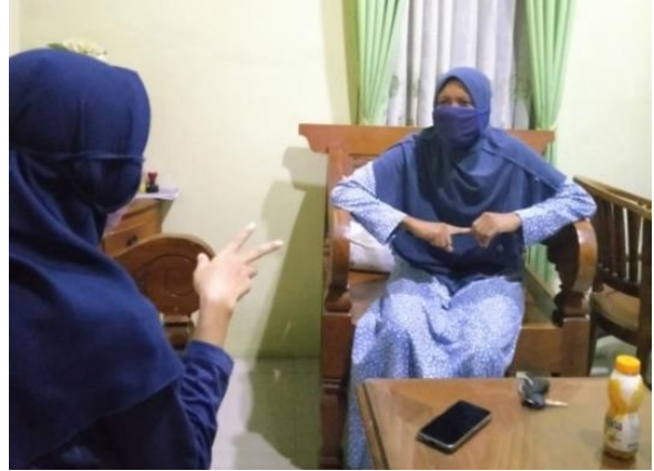
Gambar 3. Wawancara secara langsung

Pelaksanaan kegiatan diawali dengan pengisian kuesioner yang telah disediakan oleh Pilot Project Teams Erona tentang perilaku dan pengetahuan partisipan tentang pencegahan penyebaran Covid-19.